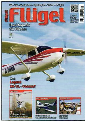
Titel: Legend - 600 im Anflug